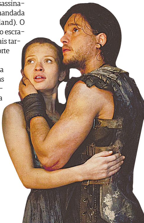
Milo (Harington) luta para ficar com amada

Além de lutar contra dezenas de gladiadores numa batalha que remonta a tragédia de sua cidade, o herói precisa vingar a morte de seus pais, salvar sua amada das garras do vilão e ainda fugir da destruição das lavas que tomam Pompeia. Missão impossível?